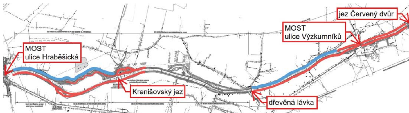
Situace stavby – úseky zahájené v roce 2025 a 2026